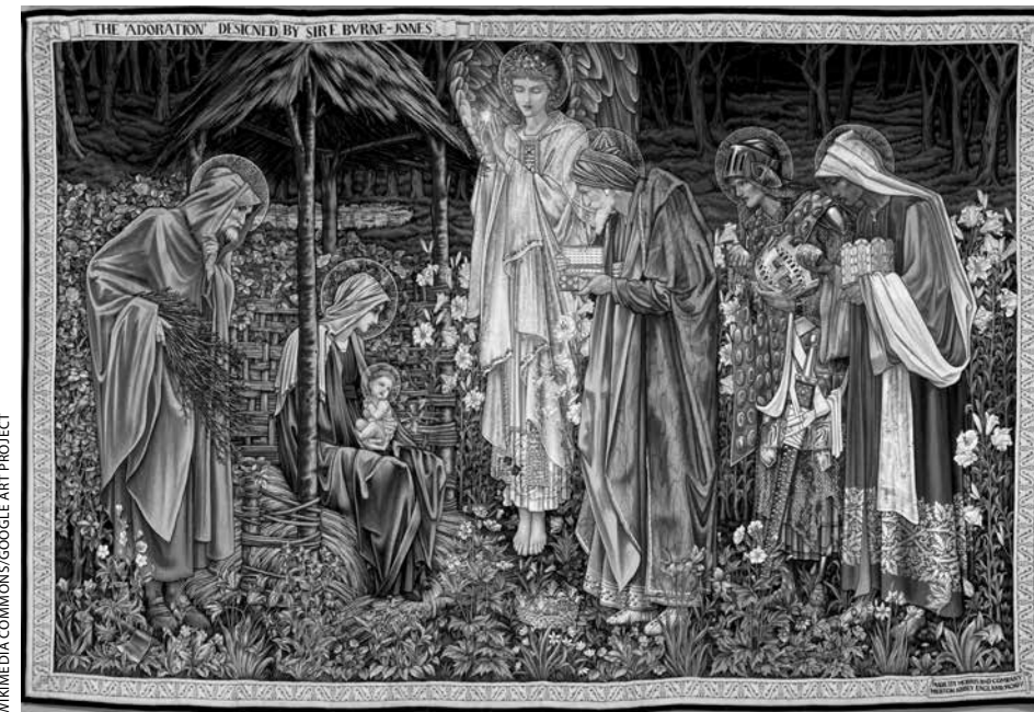
Adoracja Trzech Króli, Edward Burne-Jones, 1904 r.

Słowo epifania brzmi może nieco tajemniczo, zwłaszcza w kontekście 6 stycznia, kiedy zwykliśmy mówić, że obchodzimy Święto Trzech Króli. Kościół jednak obchodzi wtedy właśnie święto Epifanii, które ustanowił jako jedno z pierwszych świąt w ogóle.