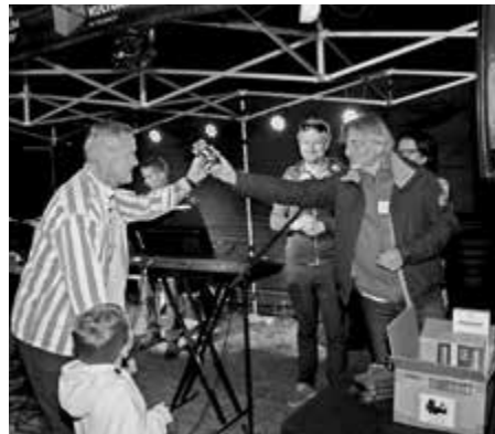
Kulminacyjnym punktem wieczoru było losowanie nagród