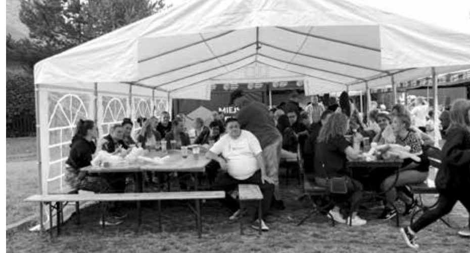
Dzień Pikniku był pogodny, a przed wieczornym deszczem chroniły nas namioty