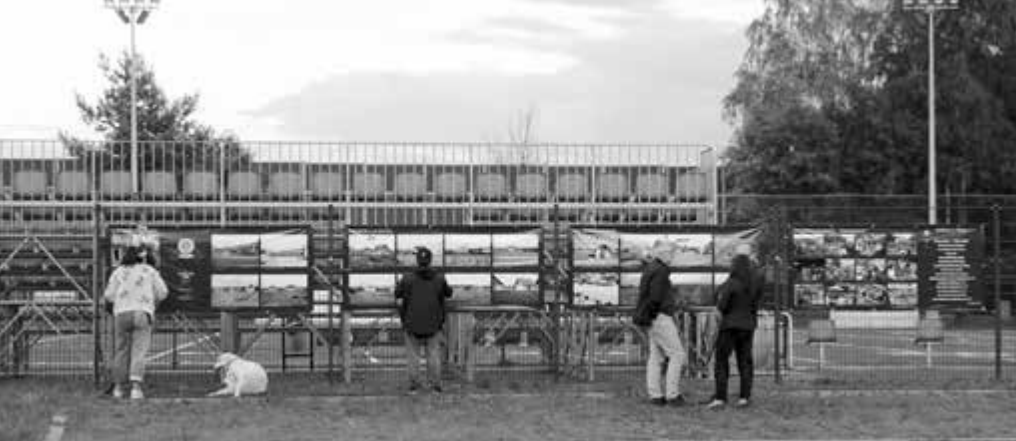
Z okazji jubileuszu Rada przygotowała na banerach wystawę archiwalnych zdjęć z budowy osiedla oraz wspomnienie odbytych już trzynastu Pikników