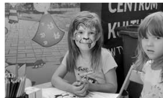
Do pani malującej buziek też ustawiała się kolejka chętnych