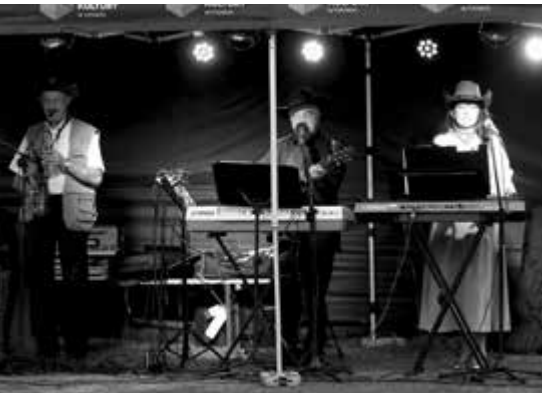
Biesiadę Śląską oraz znakomitą zabawę do końca imprezy zapewnił nam zespół Jorgusie