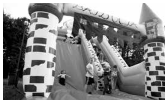
Oblegany przez najmłodszych dmuchaniec zjeżdżalnia