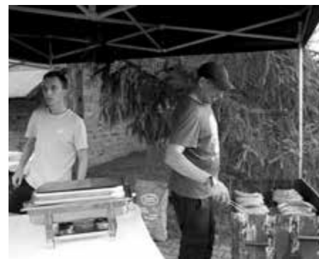
Nie mogło zabraknąć tradycyjnych kielbasek z grilla i tyskiego piwa – dla dorosłych rzecz jasna