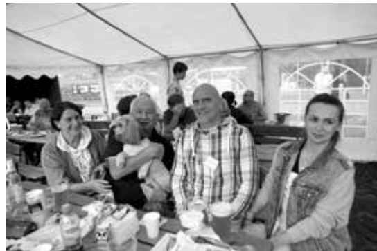
Pupile były mile widziane