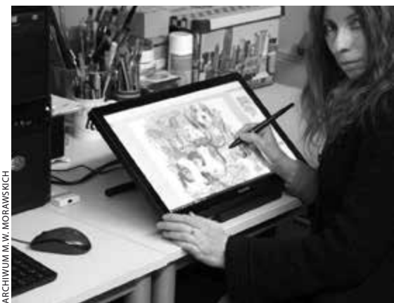
Rysunki Małgosi powstają najczęściej na tablecie, ale tworzy też tradycyjnymi technikami (jak ilustracja u góry)