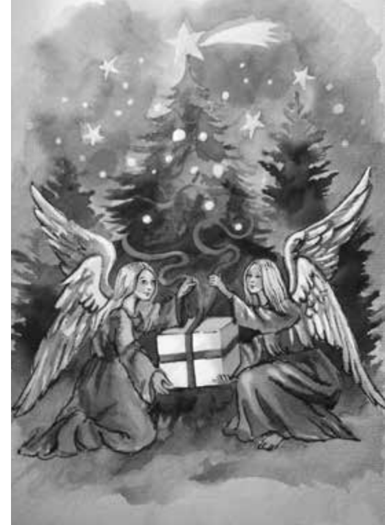
Kartka świąteczna autorstwa Małgosi dla rodziny wspieranej przez parafię w ramach akcji „Szlachetna paczka”

Nadal główną specjalizacją są layouty gazet, ale projektujemy praktycznie wszystko od logo firmowego do wielkich billboardów na budynkach. Projektujemy nadal książki, albumy, foldery, plakaty. Mamy wierne grono klientów, w tym całkiem sporo instytucji katolickich jak np. oblaci NMP w Poznaniu czy