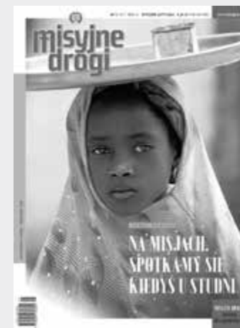
Okładka „Misyjnych Dróg” w najnowszym layoutcie, nr styczeń–luty 2023 r.