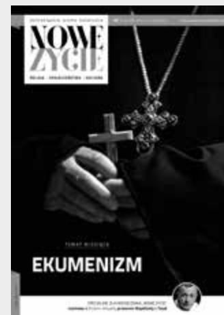
Okładka miesięcznika „Nowe Życie”, projekt z 2016 r., w wydaniu na styczeń 2019 r.