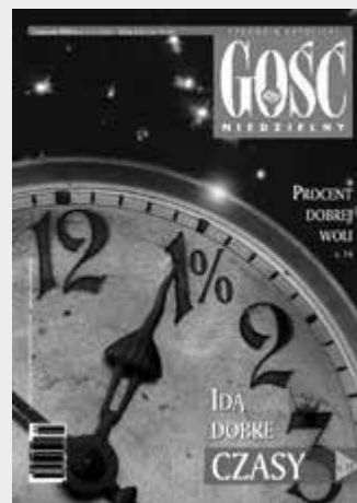
Okładka „Gościa Niedzielnego” w layoutcie z 2004 r., z datą 2 stycznia 2005 r.